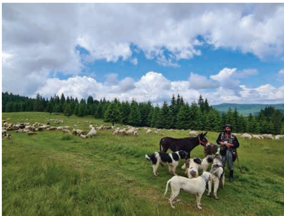
Fig. 1 Văratul oilor, Stâna Piliș. Fig. 1 The summer pasture of the sheep, Piliș sheepfold