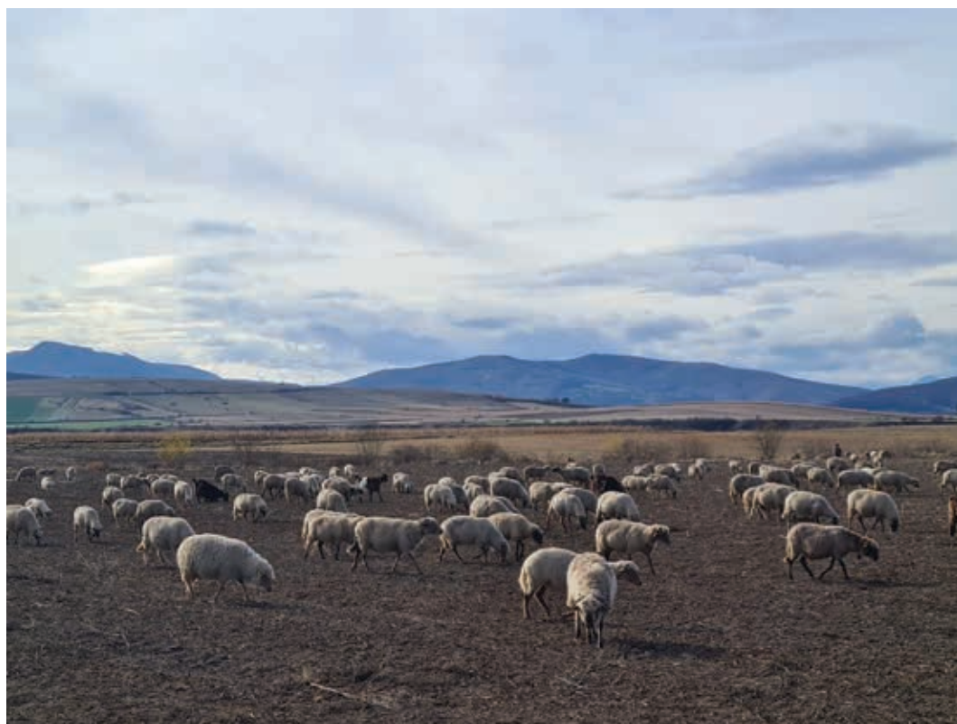
Fig. 4 Drumul oilor spre câmpie, 2023. Fig. 4 Droving the sheep towards the plains, 2023.