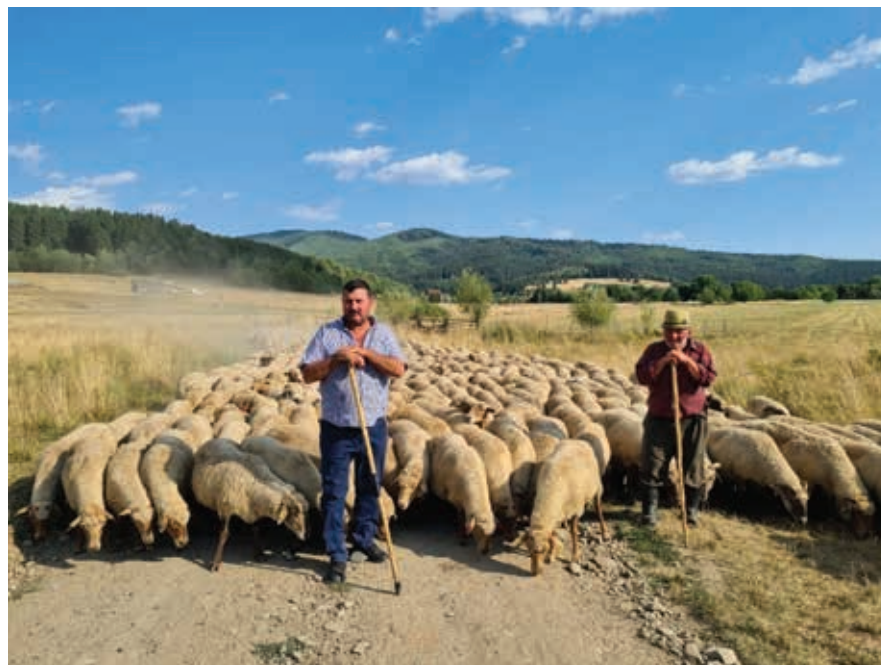
Fig. 2 Drumul oilor spre câmpie, 2022. Fig. 2 Droving the sheep towards the plains, 2022.