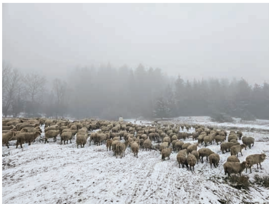
Fig. 7 Iernatul oilor, 2023.